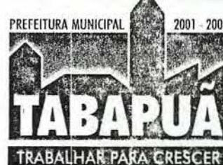
TABELA ANEXA - TABAPUÃ